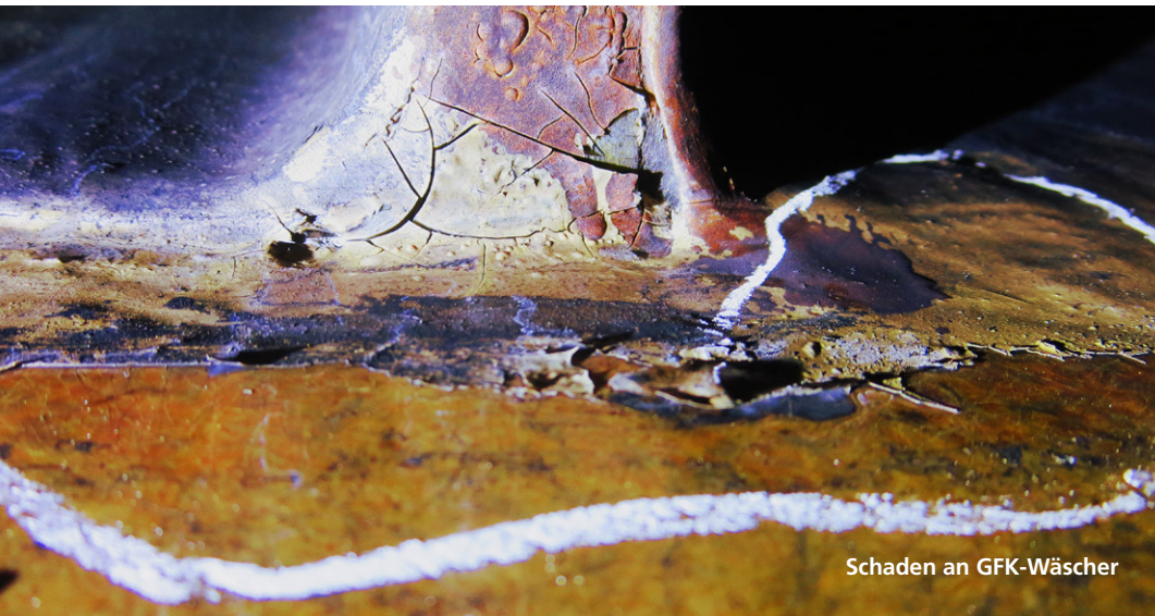
Schaden an GFK-Wäscher