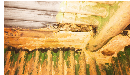
Kesselbeschichtung: Korrosion und Kosten minimieren